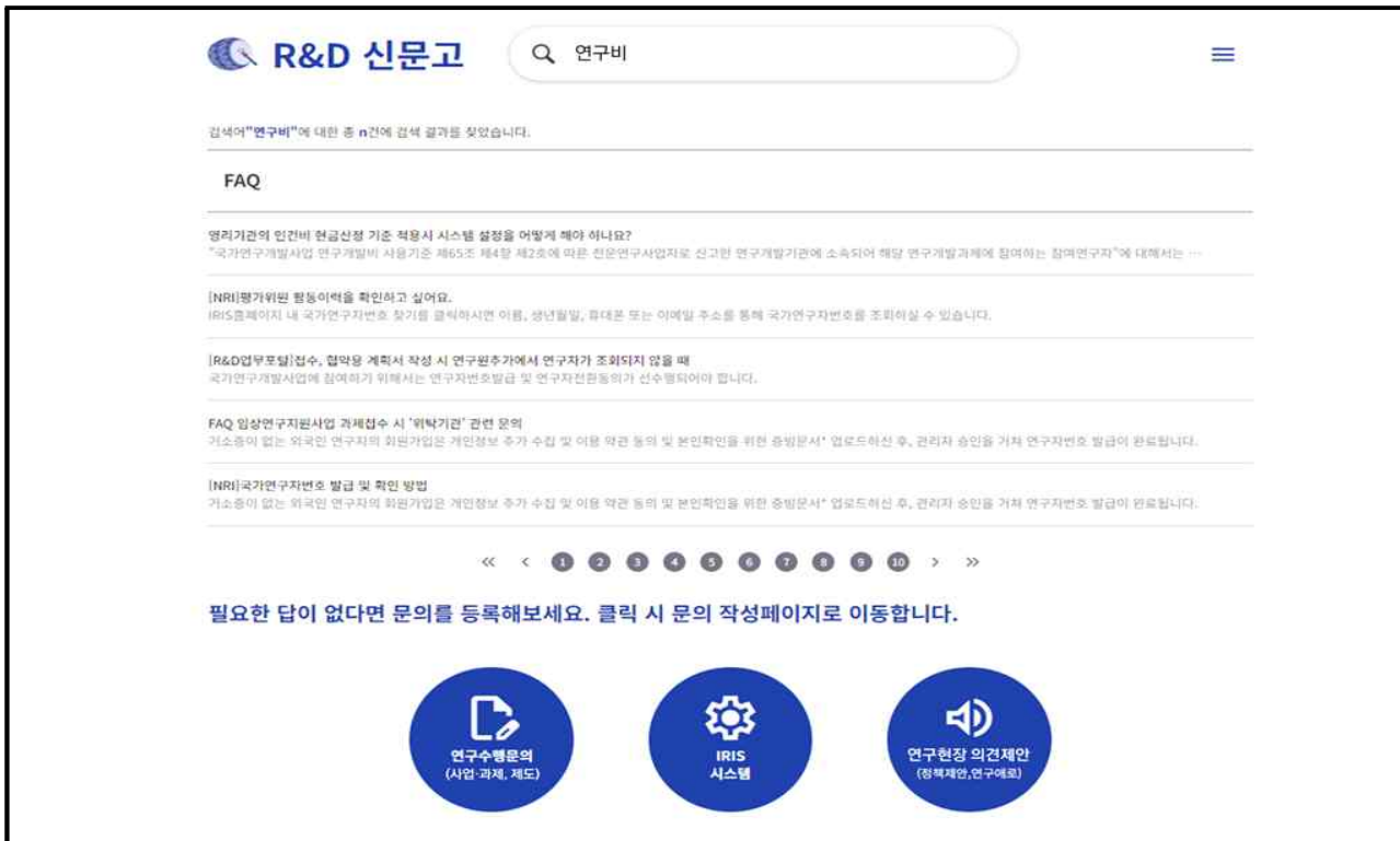
기존 문의 내용 검색 및 신규 작성